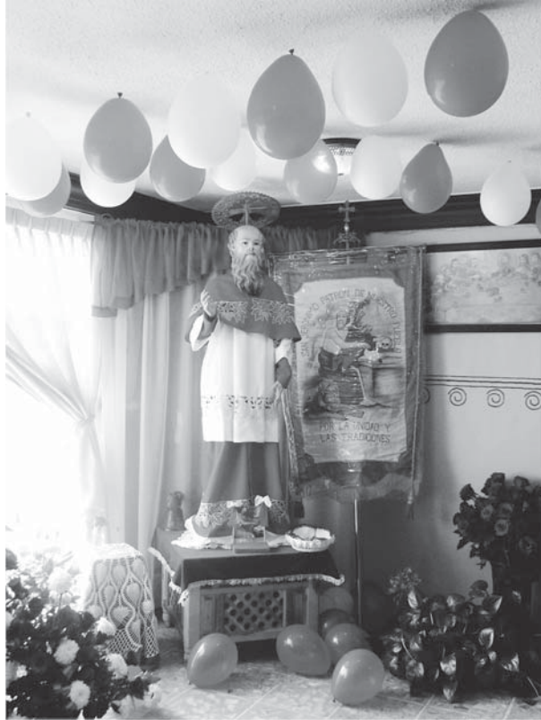
Imágen del Santo Patrón en peregrinación a la casa de una familia de originarios (agosto, 2012)