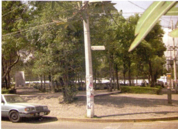
Jardín público ubicado en la Avenida San Jerónimo, entre las calles de Asunción y Benito Juárez, que los asistentes a la reunión del 30 de abril de 2011 aceptaron llamar "Aculco".