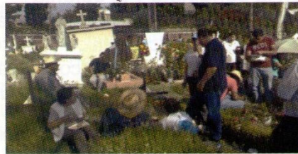
Durante los días de muertos, 1 y 2 de noviembre, la comunidad se encuentra, íntegra e interactúa en el Panteón de San Jerónimo Aculco Lídice.

Los estudios arqueológicos del hallazgo los realizó el Instituto Panamericano de Geografía e Historia, en su reporte también se recogió la opinión de nuestros mayores, los que con entusiasmo y orgullo afirmaron que en ese sitio