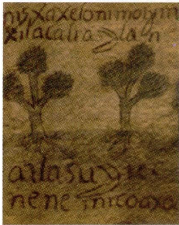
Lámina del Códice de San Pedro Cuajimalpa donde se menciona a San Jerónimo en el año 1534.

Una fuente de información sobre el origen, geografía, linderos, autoridades y eventos relevantes de los pueblos originarios está en los códices